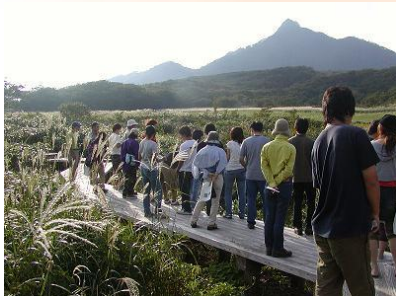
鏡ヶ成湿原から見た烏ヶ山