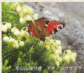
月山山頂付近 アオノツガサクラ