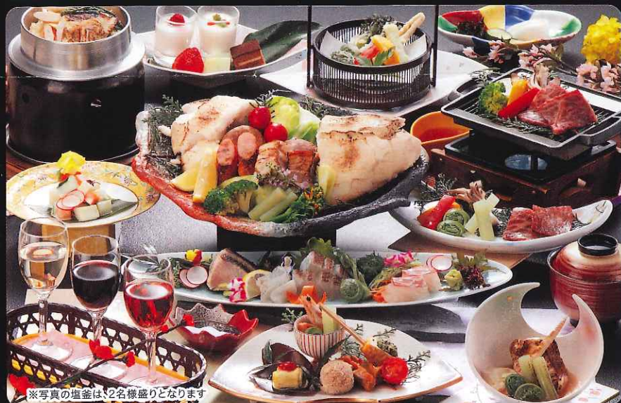
※写真の塩釜は、2名様盛りとなります