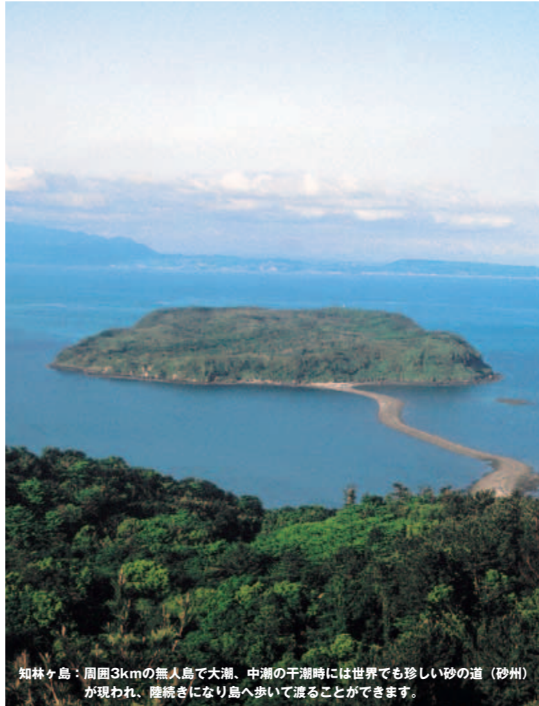
知林ヶ島：周囲3kmの無人島で大潮、中潮の干潮時には世界でも珍しい砂の道（砂州）が現われ、陸続きになり島へ歩いて渡ることができます。

自然と人、人と人をつなぐリゾートホテル 休暇村 National Park Resort