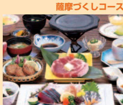
薩摩づくしコース