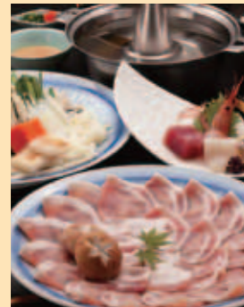
黒豚しゃぶしゃぶコース

飼料にこだわった地元指宿産「アミノ豚」を使用した「黒豚しゃぶしゃぶコース」が自慢。このほか、春のカツオや秋のイセエビ、キビナゴなど、太平洋と東シナ海が交わる海域ならではの魚介類も豊富にご用意しました。コース料理のほか一品料理もそろっているので、好きな味を楽しめます。