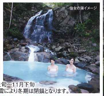
仙女の湯イメージ