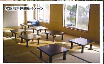
本館無料休憩所イメージ