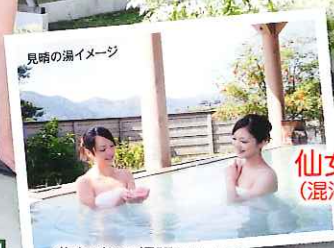
見晴の湯イメージ

昔ながらの網張らしい、 レトロな雰囲気の中、42℃~44℃のお湯で しっかり温まっていただけます。