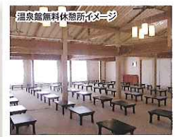
温泉館無料休憩所イメージ