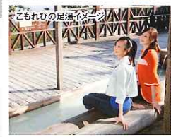
こもれびの足湯イメージ