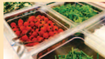
信州サラダコーナー