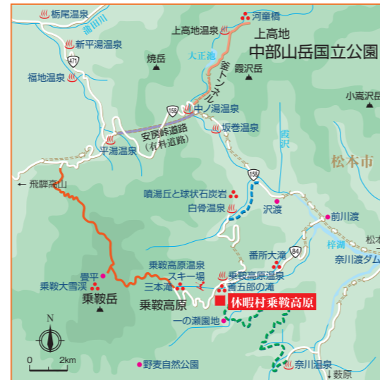
●●● 2012年度冬より開通予定 ——— マイカー規制 - - - 冬期通行止め

休暇村は、全国の国立公園や国定公園の中にあつて、いつでも誰でも気軽にご利用いただける宿泊施設です。豊かな自然環境はもちろん、地域の歴史・文化・産業や人々との出会いなど、多彩な「ふれあいプログラム」をご体験いただけます。