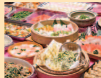
バイキングコーナー

信州の味覚「そば」をはじめ、地元の素材が入った郷土料理や、焼きたてパン、野菜王国の長野らしいサラダコーナーなど、季節のバイキング料理をご堪能ください。