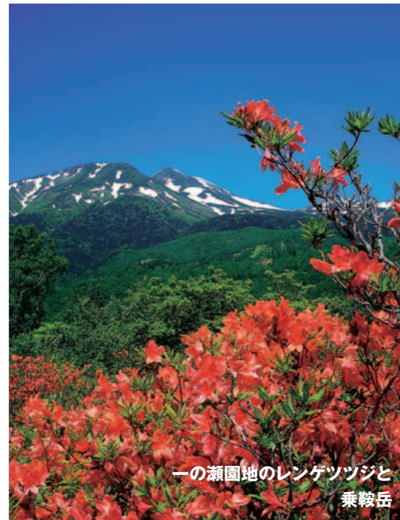
一の瀬園地のレンゲツツジと乗鞍岳

自然と人、人と人をつなぐリゾートホテル 休暇村 National Park Resort