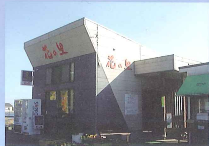
●花の里外観、駐車場、喫茶室、トイレ完備