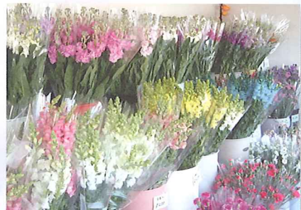
●切り花もたくさん揃えてます