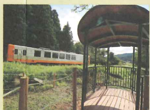
ゆりてつてんぼうだい