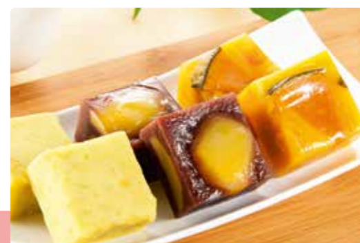
陸中宮古 つちや本舗の蒸ししょうかん 3種セット