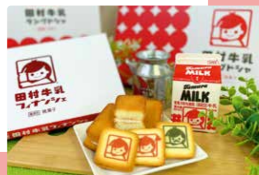
庄内羽黒 田村牛乳 ラングドシャ

他人の著作権を侵害する写真、公序良俗に反する写真、他人のプライバシーを侵害する写真によるご応募は無効といたします。投稿写真内で確認できる対象物によって肖像権等の第三者の権利侵害があった場合、当社は一切責任を負いません。