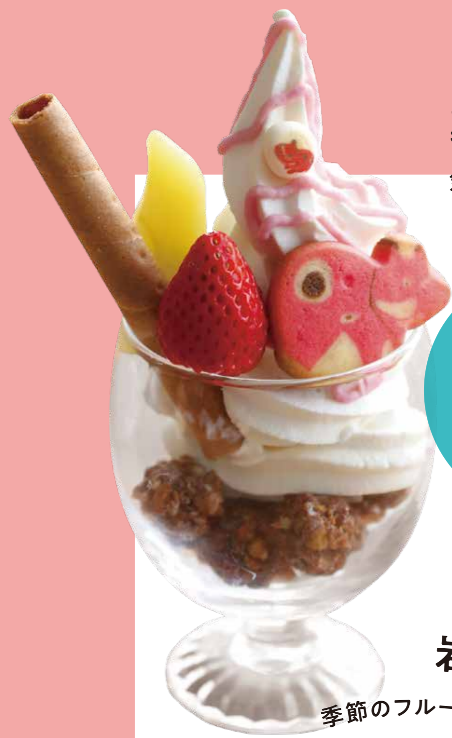
裏磐梯 気持ちを形に 「会津 ベコってパフェ」

会津の牛乳入りソフトクリームでオリジナルパフェを作ろう。赤べこビスケットやフルーツをデコレーション。