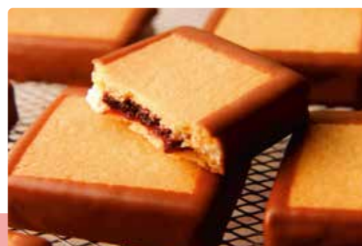
支笏湖 北のちいさなケーキ ハスカップジュエリー