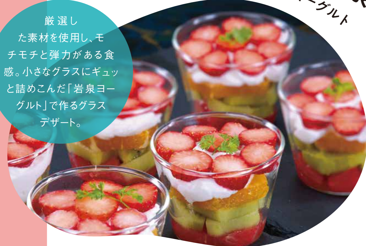
岩手網張温泉 季節のフルーツと岩泉ヨーグルト

厳選した素材を使用し、モチモチと弾力がある食感。小さなグラスにギュッと詰めこんだ「岩泉ヨーグルト」で作るグラスデザート。