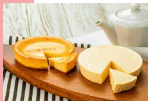
岩手網張温泉 小岩井農場からの贈り物 チーズケーキ2個セット

特賞 ご当地スイーツ 7箇所分…1名様 各休暇村賞 ご当地スイーツ1箇所分…各休暇村2名様 計14名様