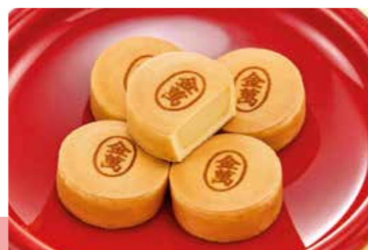
乳頭温泉郷 秋田銘菓 金萬