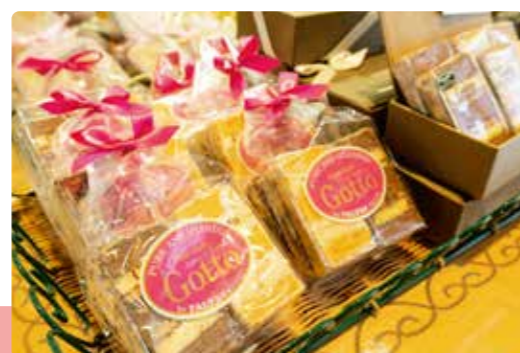
気仙沼大島 「Gotto」詰め合わせ