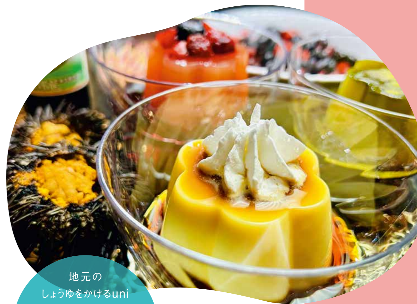
庄内羽黒 季節のフルーツ使用 特製クレームブリュレ

地元のしょうゆをかけるuniプリン、紫蘇がほんのり香る赤shisoプリン。黒平豆入りの黒蜜をかけるmatchaプリンの3種。