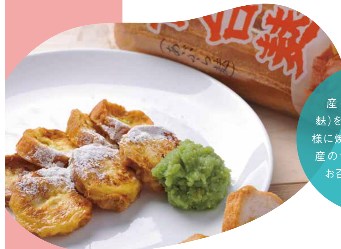
気仙沼大島 仙台麩レンチトーストとずんだ餡

厳選した素材を使用し、モチモチと弾力がある食感。小さなグラスにギュッと詰めこんだ「岩泉ヨーグルト」で作るグラスデザート。