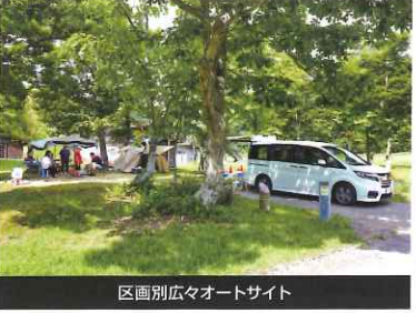
区別別広々オートサイト