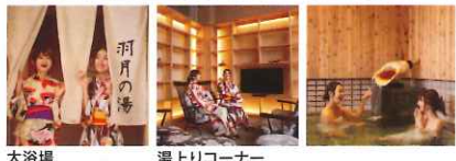
大浴場 湯上りコーナー