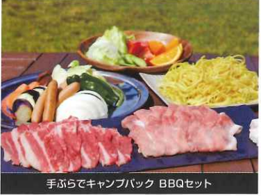
手ぶらでキャンパック BBQセット