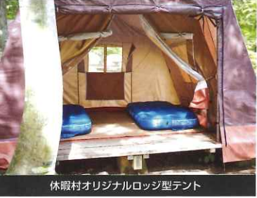
休暇村オリジナルロッジ型テント

羽黒山キャンプ場から車で12分 営業時間/6:00~22:00 (最終受付/21:20) 入浴料金/大人:450円、小人:220円 定休日/毎月第3木曜日 TEL/0235-62-4855