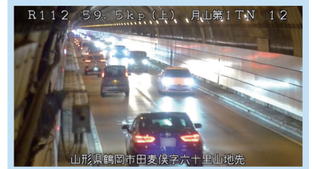
13時台 月山第一トンネル内 (山形方面を望む)