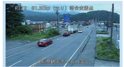
17時台 落合交差点付近 (酒田方面を望む)