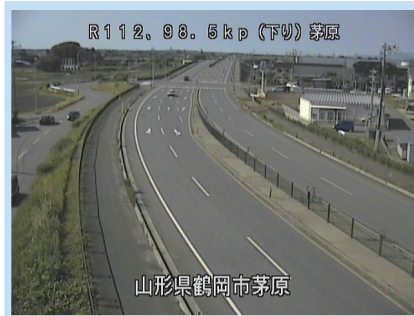
15時台 茅原交差点付近 (酒田方面を望む)