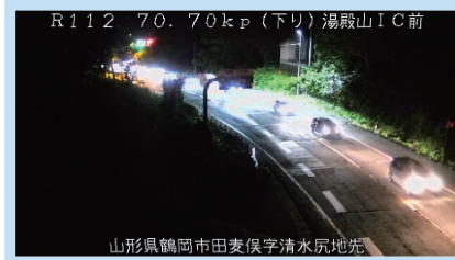
23時台 湯殿山IC付近 (酒田方面を望む)