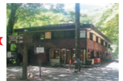
釣り券発売所 湯滝レストハウス