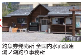
釣り券発売所 全国内水面漁連 湯ノ湖釣り事務所