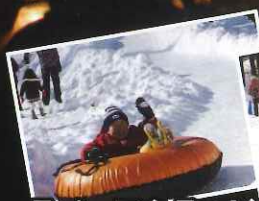
スノーアクティビティ

開催場所 群馬県吾妻郡嬭恋村大前細原2277 プリンスランド特設会場(軽井沢おもちゃ王国内)