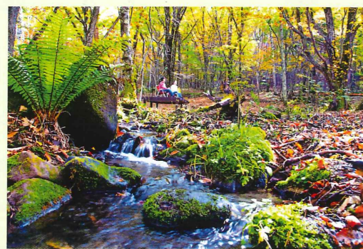
園地には沢山の小さな川が流れています。水温は真夏でも10度前後までしか上がりません。