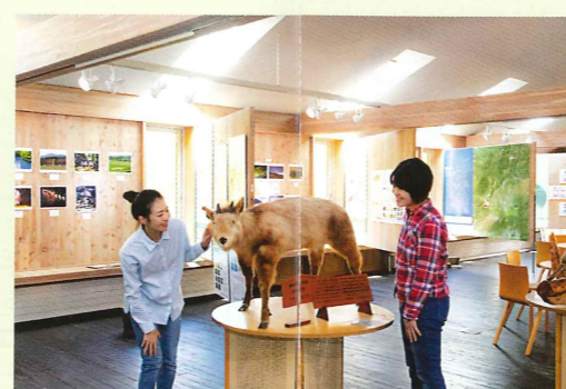
鹿沢インフォメーションセンターは、園地の紹介や、動植物の自然環境・周辺観光の案内をしています。Wi-Fiが無料で利用できます。