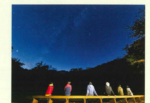
標高が高く、周囲に人工物も少ないため、お天気が良ければ満天の星空をお楽しみいただけます。