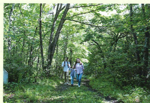
マイナスイオンたっぷり。鳥や虫の声、風の音を感じながら、木漏れ日のお散歩道を歩きましょう。