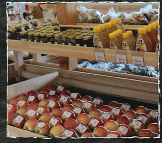
お土産が大体揃います◎

キャベツ、とうもろこし、トマト、 花豆、鎌原きゅうり、果物、雑貨、 地元の多品目野菜、加工食品等