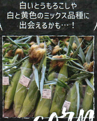
白いとうもろこしや 白と黄色のミックス品種に 出会えるかも…!