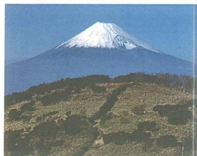
▲達磨山からの富士山