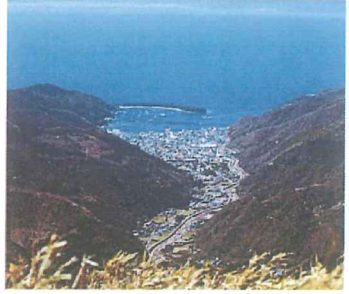
▲沿線から戸田湾を望む