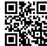
▲南伊豆町観光協会