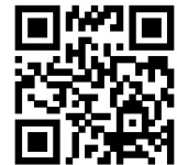
▲ヒリゾ浜情報「仲木へ行こうよ」