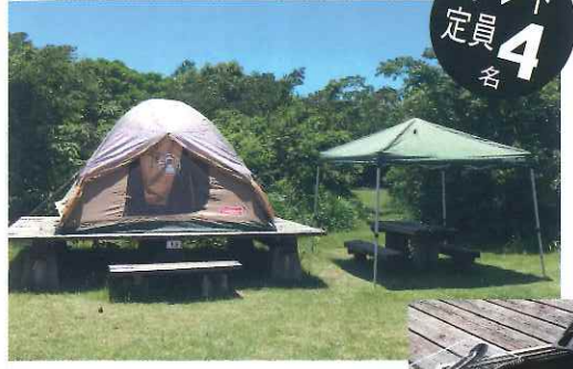
テント...ogawa オーナーロジタイプ 52RT/C 2253 220×300×高208 cm