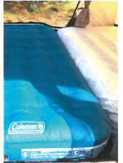
厚いエアーマットで心地快適。