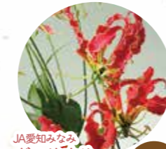
JA愛知みなみ グロリオサ 中心的品種ロイヤルを始め、レモンイエロー・オレンジ等を栽培しています。 JA愛知みなみ 開発特販課 ☎0531-34-1050