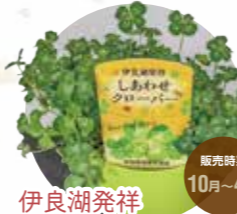
伊良湖発祥 しあわせクローバー 伊良湖岬で発見された高確率で四つ葉以上が生える奇跡のシロツメクサを基に栽培されたものです。道の駅あかばねロコステーション ☎0531-45-5088