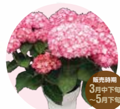
渥美半島アジサイ スズキ農園オリジナル品種をはじめ、様々な品種を常にベストな状態でお届けします。 スズキ農園 ☎090-8959-9573