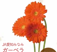
JA愛知みなみ ガーベラ 品種・色ともにバラエティー豊富で、1年を通してその日にあった花を楽しめます。 JA愛知みなみ 開発特販課 ☎0531-34-1050