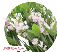
JA愛知みなみ スイートピー 花色も豊富で、独自の甘い香りがあり、多くの人に親しまれています。 JA愛知みなみ 開発特販課 ☎0531-34-1050