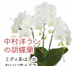
中村洋ランの胡蝶蘭 ミディ系は、かわいいうちサイズで手軽に楽しめます。大輪は、お祝い、仏事などに用いられています。 中村洋ラン ☎0531-38-0071