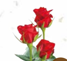
JA愛知みなみ パラ 色や花型などについて多くの品種を取り入れています。 JA愛知みなみ 開発特販課 ☎0531-34-1050