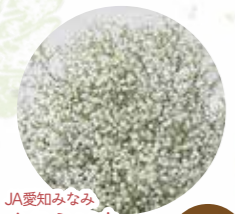
JA愛知みなみ カスミンソウ 花持ちがよく、ステムが硬く、ボリュームがあり、コントラストが美しいです。 JA愛知みなみ 開発特販課 ☎0531-34-1050