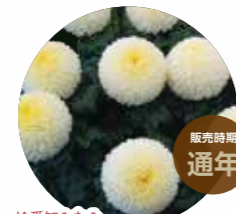
JA愛知みなみ ディスパットマム 計画栽培を厳しく実施し、多品種構成に富んだ栽培を実施しています。 JA愛知みなみ 開発特販課 ☎0531-34-1050