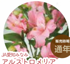
JA愛知みなみ アルストロメリア 約70品種を栽培しています。業務用から一般小売まですべてのニーズに応えるまで、積極的に新品种の導入に取り組んでいます。 JA愛知みなみ 開発特販課 ☎0531-34-1050