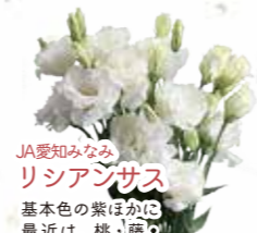
JA愛知みなみ リシアンサス 基本色の紫ほかに最近では、桃、藤、白・複色とカラフルになり、花形も一重・二重・八重と多様な形があります。 JA愛知みなみ 開発特販課 ☎0531-34-1050