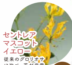
セントレア マスコット イエロー 従来のグロリオサに比べ、花が非常に小さいのが特徴。鮮やかな黄色でフラワーアレンジやブーケなどにも合わせやすいです。 JA愛知みなみ 開発特販課 ☎0531-34-1050