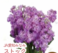
JA愛知みなみ ストック スプレミタイプを中心に、白、ピンク、クリーム系があります。 JA愛知みなみ 開発特販課 ☎0531-34-1050