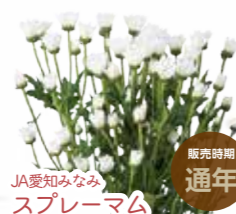
JA愛知みなみ スプレーマム 多種多様な色花形で栽培しているため、ウエディングブーケ・洋花アレンジ・仏花用と用途に応じて様々な形に利用できます。 JA愛知みなみ 開発特販課 ☎0531-34-1050