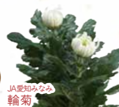
JA愛知みなみ 輪菊 日本一のシェアを誇り、高い技術力などにより一年を通して高品質の花を出荷しています。 JA愛知みなみ 開発特販課 ☎0531-34-1050