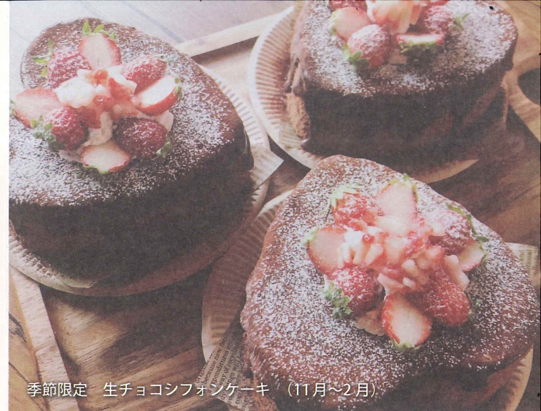
季節限定 生チョコシフォンケーキ (11月~2月)