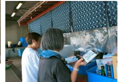
沖島婦人会の皆様による美味しいお弁当を頂きます。