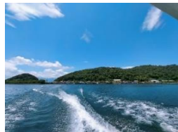
船長のご厚意で、8・1の伊崎の棹飛びが行われる伊崎寺を見に連れて行っていただきました