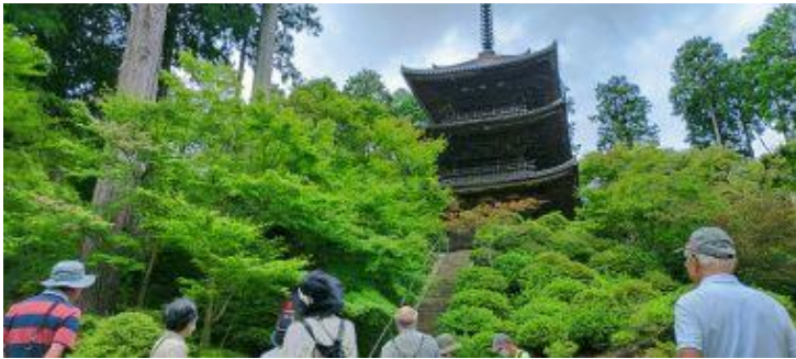
国宝の本堂と三重塔