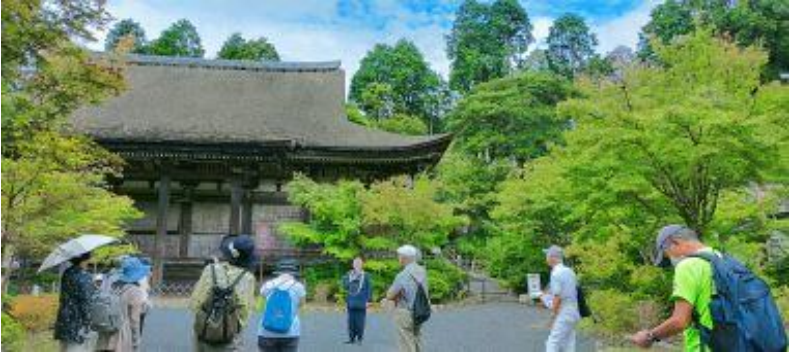
住職さんがマイクを持ち、 面白く案内をしてくださいました