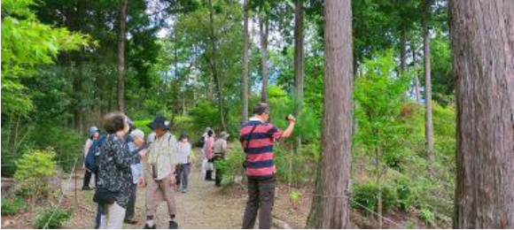
紅葉と国宝の古刹で有名