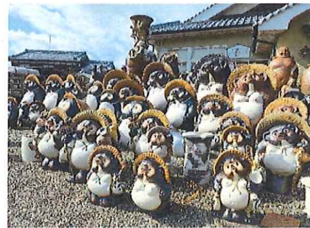
県外の方ばかりだったので、信楽を少し楽しんでもらいました