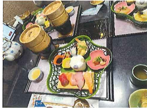
「チーム大沼」で和気藹々♡