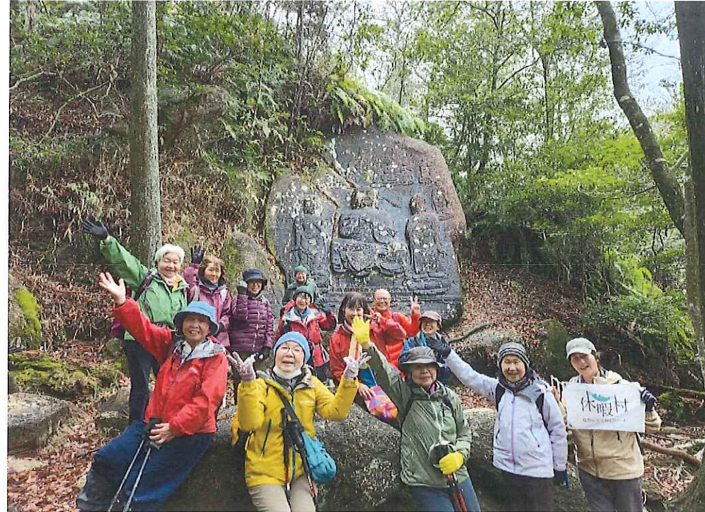
狛坂摩崖仏まで90分歩き続け疲労もある中、この笑顔！！達成感！