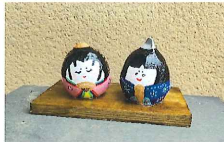
街全体にひな人形があり、 季節を感じました