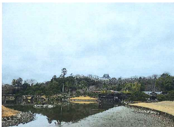
琵琶湖の水位が低いことで、玄宮園の池も水が少ない状態