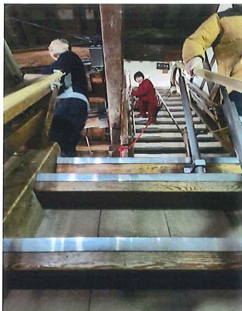
彦根城の中 とても急な階段