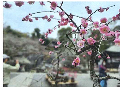
梅林は見ごろを迎えていました