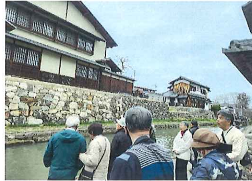
ラコリーナ近江八幡