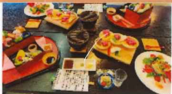
ツアーオリジナル 会席