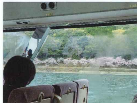
曇りからお天気回復してきました☆彡