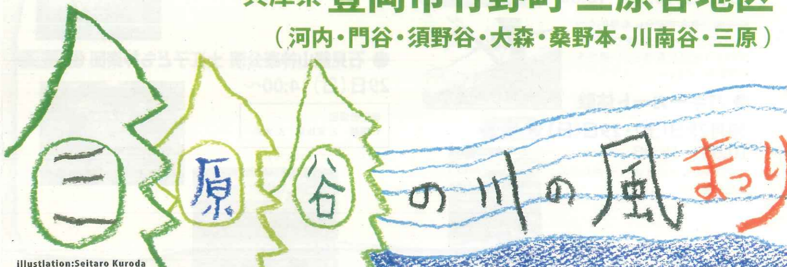
illustration: Seitaro Kuroda