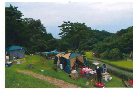
【AC電源(15A・125V)・水道付き】