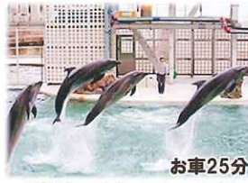
城崎マリンワールド