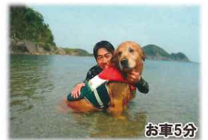
青井浜ワンワンビーチ