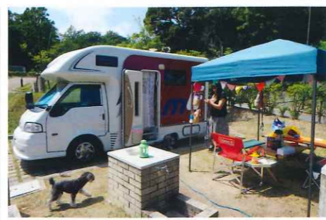
【AC電源(15A・125V)・水道付き】

【朝食ビュッフェの場合】 大人 6,800円 小人 4,800円 幼児 2,800円 【ホットサンの場合】 大人 6,300円 小人 4,300円 幼児 2,300円