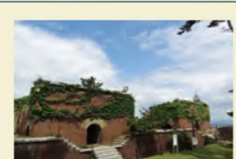
だいちほうだいあと 第2砲台跡