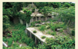
だいちほうだいあと 第5砲台跡