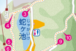
だいちほうだいあと 第1砲台跡