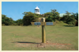
しこせんひろば 子午線広場 友ヶ島灯台西側の広場で日本標準時子午線が通る広場です。