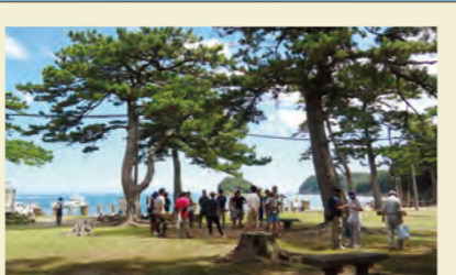
のなうらひろば 野奈浦広場 友ヶ島の玄関口。栈橋前に広がる芝生の広場で、太いクロマツが立ち並んでいます。