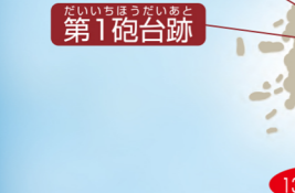
だいちほうだいあと 第1砲台跡