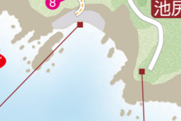
いけじり 池尻キャンプ場