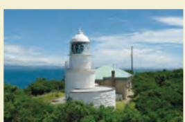
ともがしまとうだい 友ヶ島灯台 明治5年(1872年)にできた洋風建築の灯台です。現在も稼働中です。