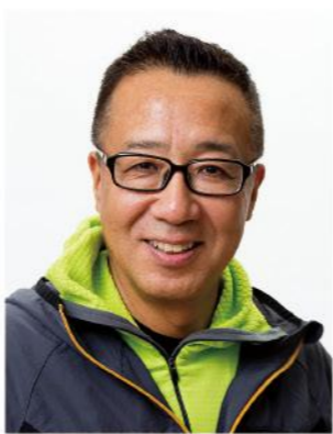
出演者 おのだ むねお 貫田宗男さん

女優。映画やドラマに数多く出演。「暗夜行路」を読んで以来、大山に憧れを抱く。エッセイも好評で、「あ言えばこう食う」は第15回講談社エッセイ賞を受賞。全国万葉フェスティバル in 鳥取 (2009年)でも鳥取県に来県。