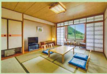
ベーシック 和室 10 畳