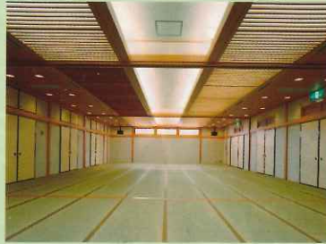
大広間 (100畳/3分割可能)