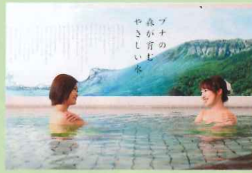
硬度13度 (超軟水) 天然水大浴場