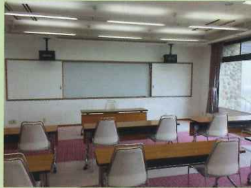
多目的ホール (約80畳/2分割可能)