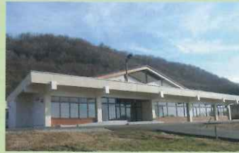
隣接レストハウスは 複数の会場設定が可能