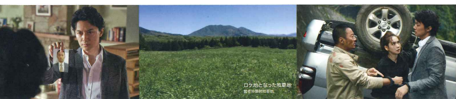
ロケ地となった牧草地 當作外景的牧草地

@MANHUNTJP FACEBOOK.COM/MANHUNTJP GAGAMOVIE