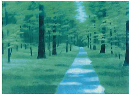
「若葉の径」 リトグラフ