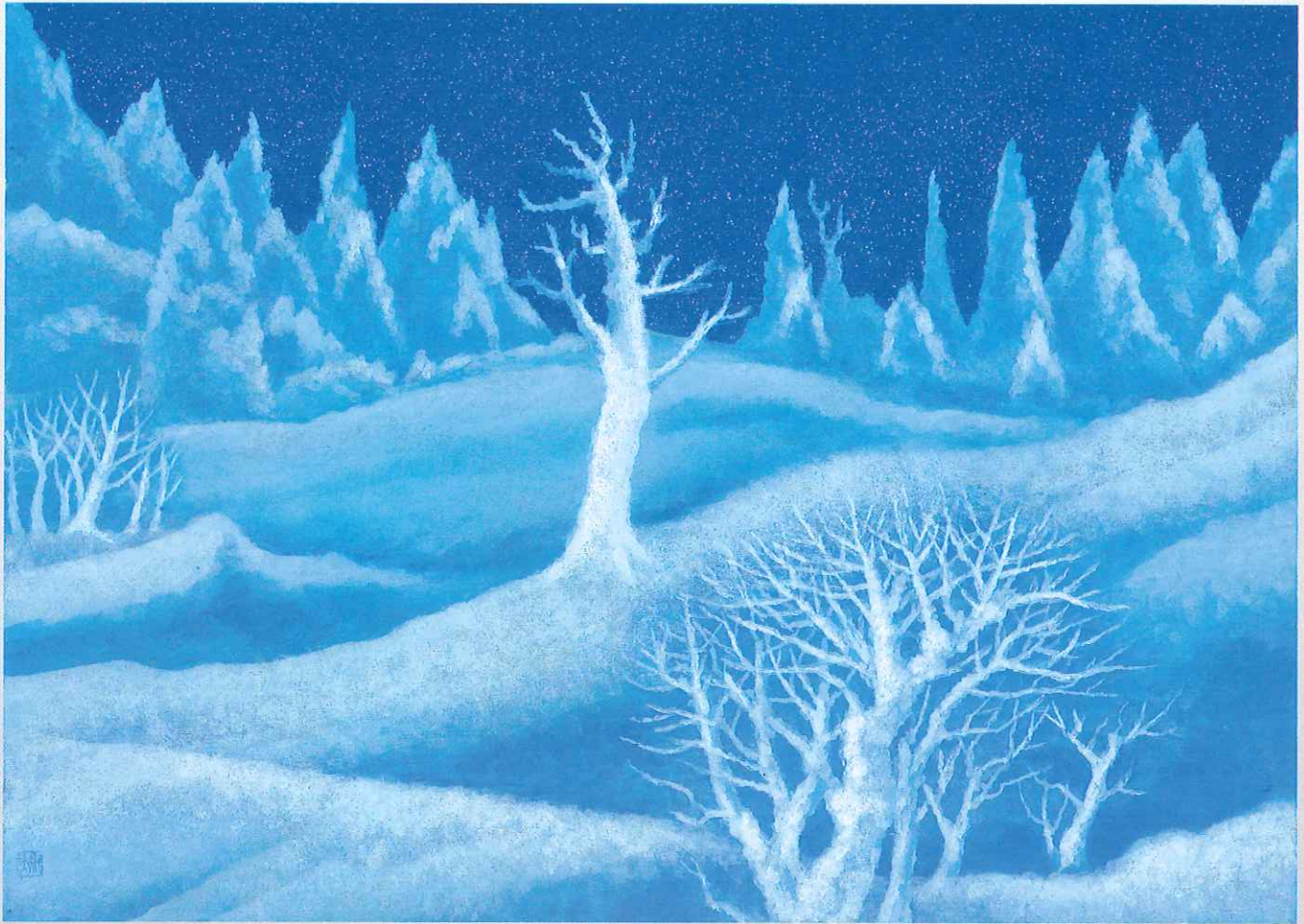
東山魁夷「月光」麻布彩色

Kagawa Prefectural Higashiyama Kaii Setouchi Art Museum