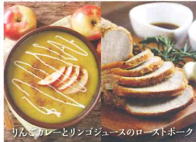
りんごカレーとリンゴジュースのローストポーク