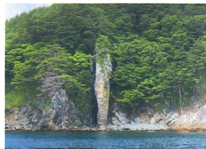
ローソク岩 国指定天然記念物

三陸復興国立公園・三陸ジオパークの中心に位置する海岸。四季を通じて美しい自然の景観が楽しめる。