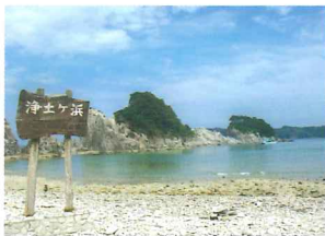
浄土ヶ浜 国指定名勝

三陸復興国立公園・三陸ジオパークの中心に位置する海岸。四季を通じて美しい自然の景観が楽しめる。