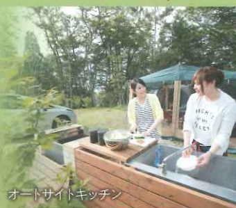
オートサイトキッチン

チェックイン/アウト 両サイトとも ●チェックイン13:00 ●チェックアウト11:00