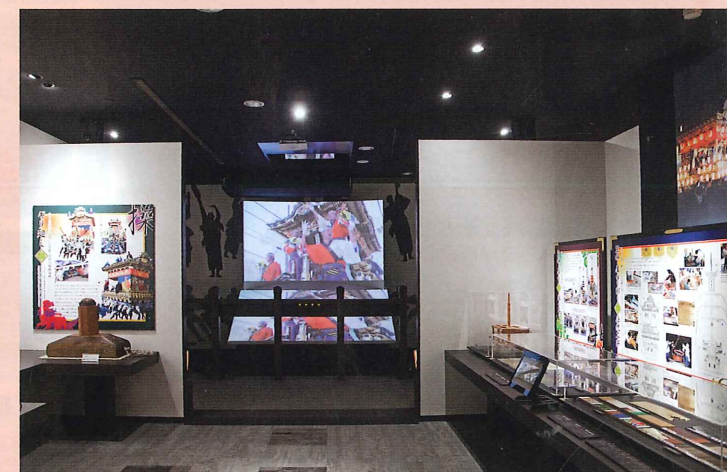
秩父夜祭の屋台や笠鉦に関する資料コーナー

Miniatures of the Shinto ritual called Saijo-sai of the Chichibu Night Festival