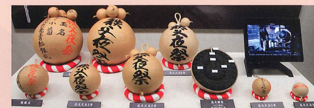
秩父夜祭を彩るスターマイン花火の玉

Balls of "Starmine" fireworks lighting up the night sky of the Chichibu Night Festival