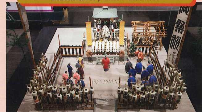
秩父夜祭の斎場祭の模型

Miniatures of the Shinto ritual called Saijo-sai of the Chichibu Night Festival