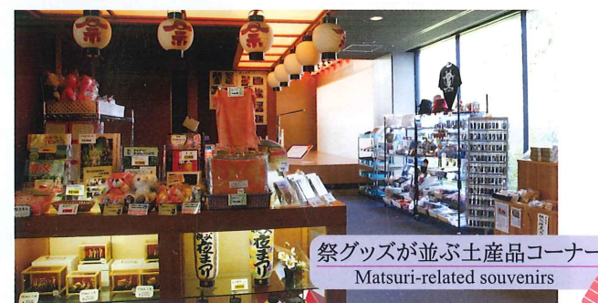
祭グッズが並ぶ土産品コーナー Matsuri-related souvenirs

Balls of "Starmine" fireworks lighting up the night sky of the Chichibu Night Festival