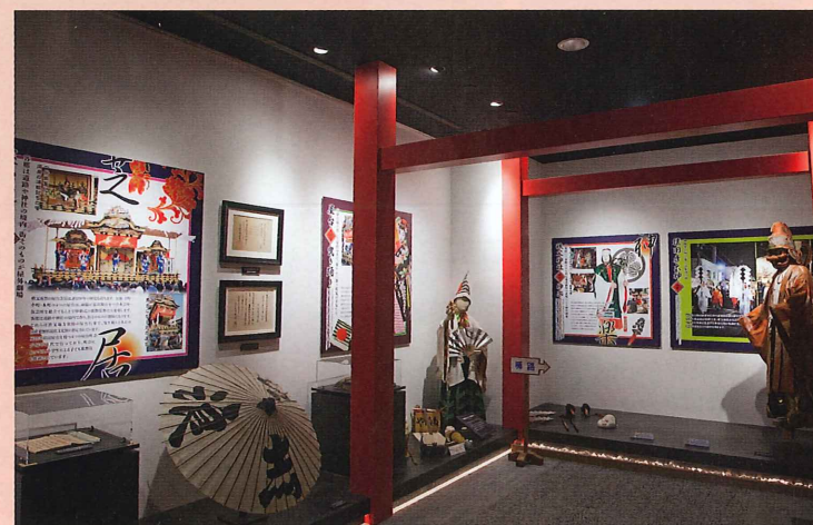
秩父夜祭の屋台芝居（歌舞伎）や神楽に関する資料コーナー

One of the main attractions of the hall. Enjoy the virtual experience of towing a parade of floats during the Chichibu Night Festival and the atmosphere of the city with its sights and sounds.