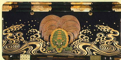
見事な金糸の亀の刺繍 Embroidered turtle of gold thread impressive in appearance

The entire Kasaboko float represents Mt. Horaisan (a God's mountain where an immortal hermit lives). Tendo (symbolizing the holy Sun) is emblazoned on the Sekidai (cloud-shaped pedestal). The embroidered turtle of gold thread on the rear curtain is impressive in appearance.