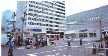
バス乗り場は鍛冶橋駐車場となります。乗り場内には待合所もあります。