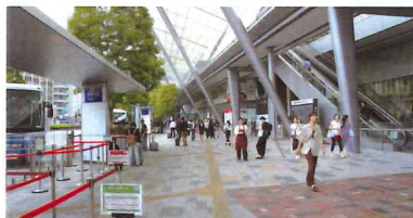
外堀通りを右側(道なりに進み徒歩5分)