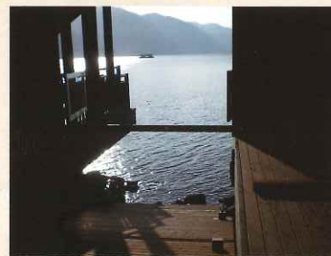
艇庫から湖面を望む

明治中頃から昭和初期、夏の中禅寺湖には外交官をはじめ、多くの外国人が避暑に訪れ、家族ぐるみで魚釣りや船遊びを楽しみました。また、外国人同士の交流はもちろんのこと、地元の人々との交流も盛んに行われていました。