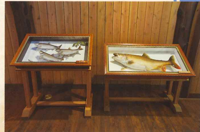
1階 中禅寺湖のマス剥製展示コーナー