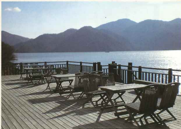
2階デッキから中禅寺湖面を望む