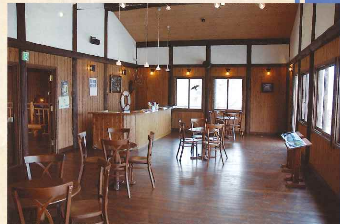
2階 喫茶・展望ホール