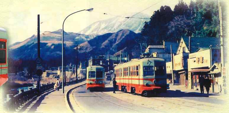
日光市内(神橋付近)を走行する日光軌道