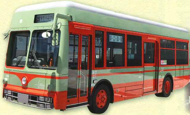
日光軌道タイプ特別車両

日光軌道は、東武グループの路面電車として日光市内を走行しておりました。最盛期には乗客数が年間551万人を記録しましたが、自動車交通量増加の影響で、1968年に営業を終了いたしました。今回導入する日光軌道タイプ特別車両は、1953年から営業廃止まで活躍した「100型ボギー車」のデザインをまとい、車内前方には横向きロングシートを採用しました。昔懐かしい路面電車の雰囲気を感じていただき旅の良い思い出にしていだければと思います。