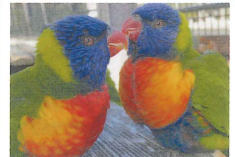
アロハガーデンたてやま

お問い合わせ (一社)館山市観光協会 TEL0470-22-2000 FAX0470-23-3000 Web site https://tateyamacity.com/ 館山市観光みなと課 TEL0470-22-2544 FAX0470-24-2404 Web site https://www.city.tateyama.chiba.jp