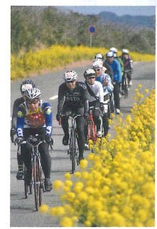
春のフラワーライン (見頃 1月下旬~2月まで)