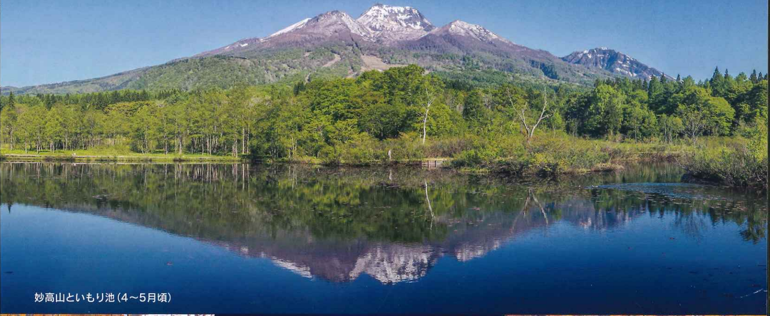
妙高山といもり池 (4~5月頃)