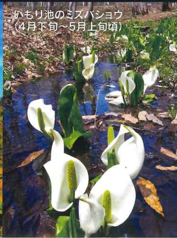
いもり池のミスバショウ (4月下旬~5月上旬頃)