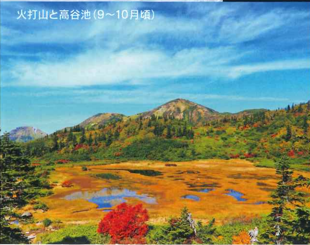
火打山と高谷池 (9~10月頃)