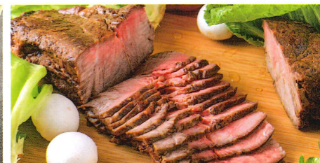
信州プレミアム牛を使った料理長の自信作 ローストビーフ手作りジャポネソースを添えて