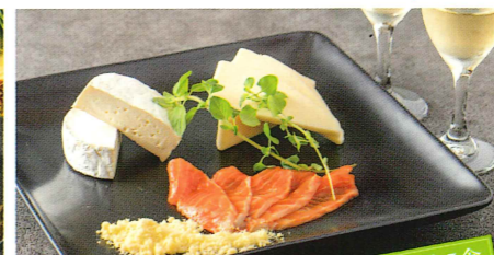
オリジナルグラスワイン白& 信州サーモンの燻製とチーズのセット

・レギュラー(1~2人前) 福味鶏・吟醸豚・信州プレミアム牛 合計約150g 3,000円