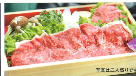
信州プレミアム牛すき焼き