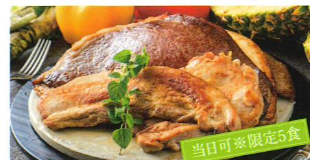
信州トリプルミートグリル

・レギュラー(1~2人前) 福味鶏・吟醸豚・信州プレミアム牛 合計約150g 3,000円