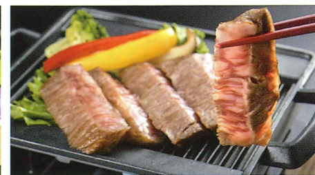
信州プレミアム牛ステーキ