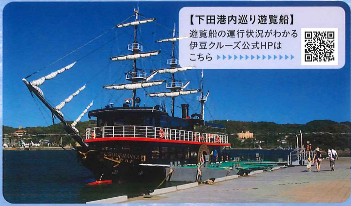
【下田港内巡り遊覧船】 遊覧船の運行状況がわかる 伊豆クルーズ公式HPは こちら