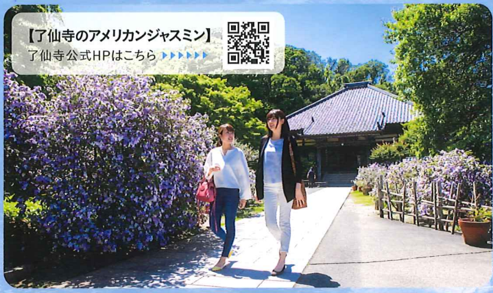
【了仙寺のアメリカンジャスミン】 了仙寺公式HPはこちら