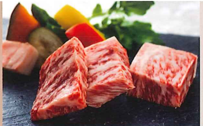
※仕入価格高騰により、料金改定を行う場合もございます。