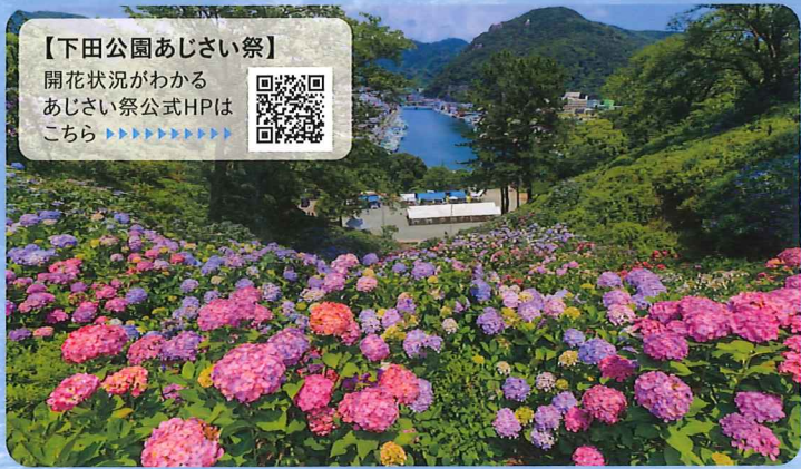
【下田公園あじさい祭】 開花状況がわかる あじさい祭公式HPは こちら