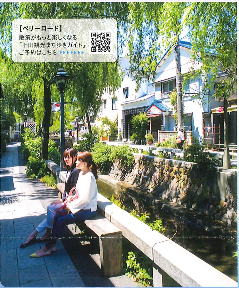
【ベリーロード】 散策がもっと楽しくなる 「下田観光まち歩きガイド」 ご予約はこちら