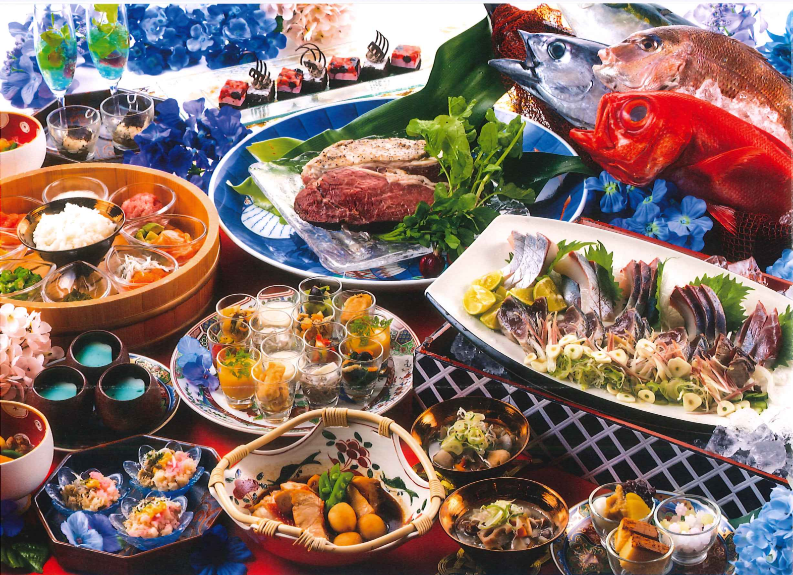
※写真はイメージです。仕入状況により料理内容の変更や器が変わる場合もございます。