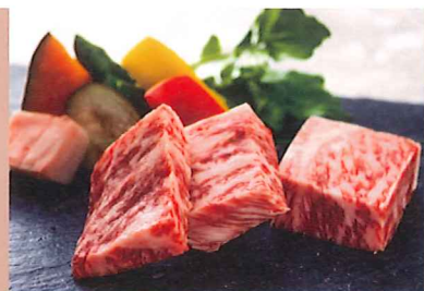
静岡A5黒毛和牛鉄板焼き 4,000円