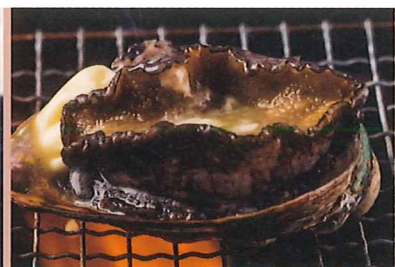
あわびの踊り焼き 3,500円