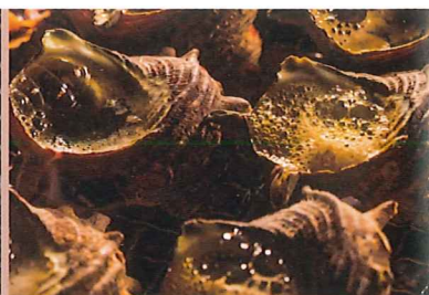
サザエつばやき3個盛り 1,500円