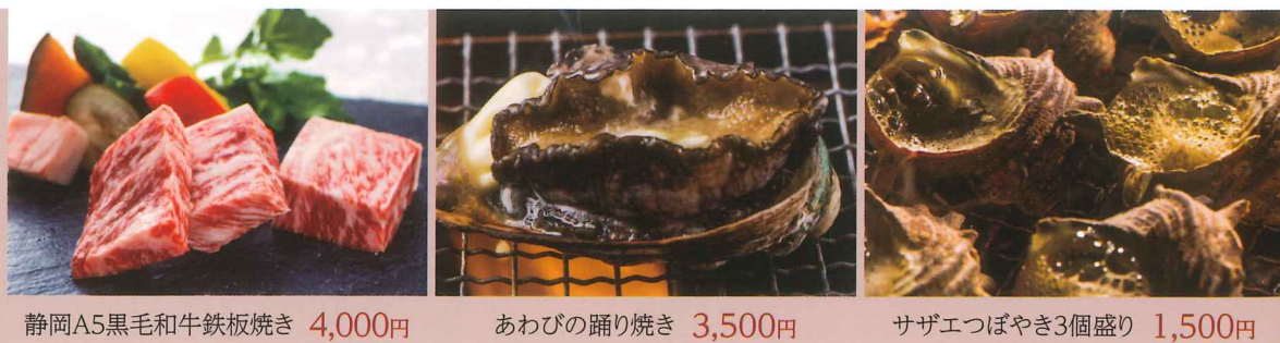
静岡A5黒毛和牛鉄板焼き 4,000円 あわびの踊り焼き 3,500円 サザエつばやき3個盛り 1,500円