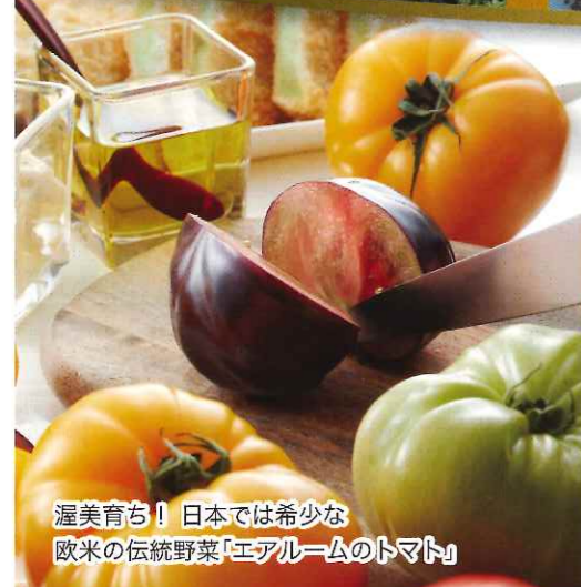
渥美育ち! 日本では希少な欧米の伝統野菜「エアームのトマト」

ソフトドリンクBAR 無料! お部屋への持ち帰りもOK! うれしいスイーツも充実しています