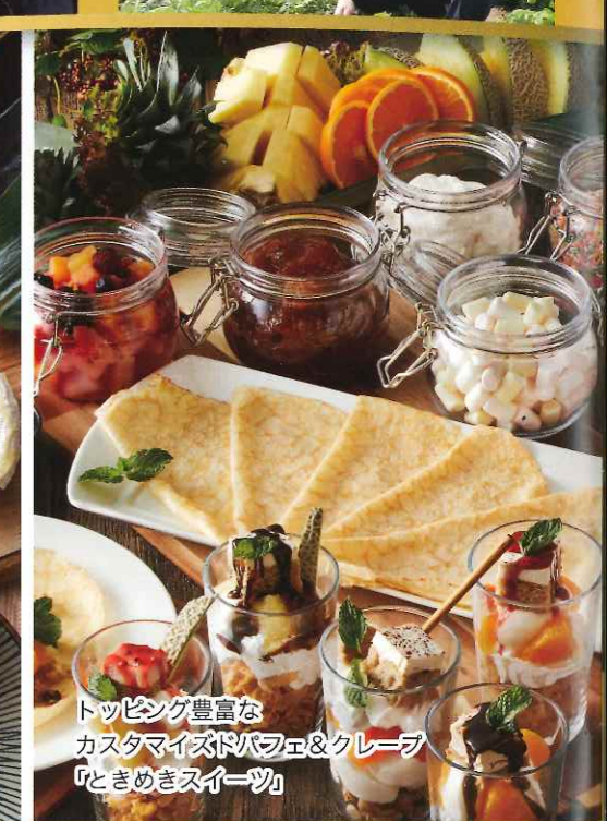
トッピング豊富なカスタマイズドパフェ&クレープ「ときめきスイーツ」