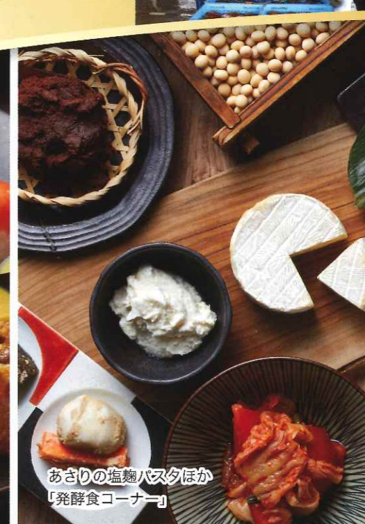
あさりの塩麹パスタほか「発酵食コーナー」