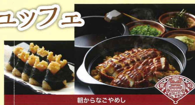
朝からなごやめし

朝からなごやめし ひつまぶし風うなぎめしや天むすといったパワフルな名古屋めしで一日の元気を充てる。 和洋食そろうた伊良湖の朝食で元気な朝をお迎えください。 三河・渥美のご当地グルメも充実!