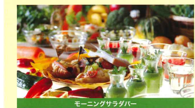
モーニングサラダバー