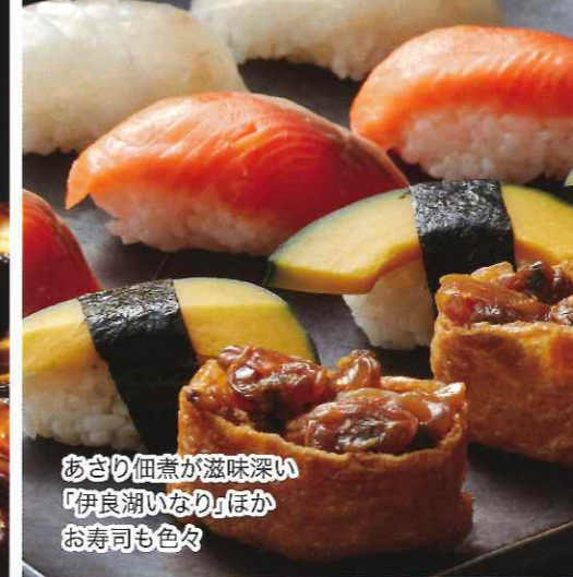
あさり佃煮が滋味深い「伊良湖いなり」ほかお寿司も色々