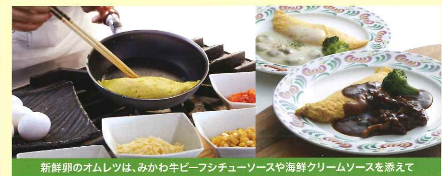
新鮮卵のオムレツは、みかわ牛ビーフシチューソースや海鮮クリームソースを添えて