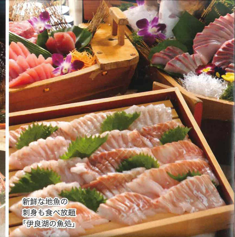
新鮮な地魚の刺身も食べ放題「伊良湖の魚処」