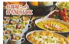
充実のスイーツコーナー