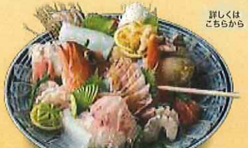
福井の地魚姿盛りとお刺身盛り合わせ (3~4人盛) 5,500円