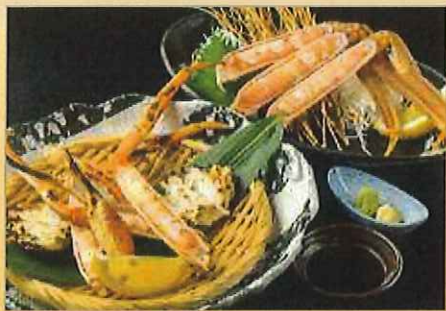
焼きがに・かに刺しセット 7,300円