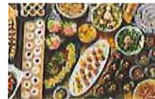
海山の幸が集まる福井の美味