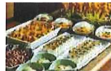
北陸3ライブキッチンコーナー

ビュッフェのテーマは「秋の地魚とベニズワイガニ」。水深800~1,500m付近に沈められた「カニカゴ」で引き揚げたこのカニは、瑞々しくて柔らかい旨味のある身が特徴です。そして福井ならではの「海の幸」を取り入れた創作料理も必見。お刺身や煮物、揚物など、福井の海山の幸をお楽しみください。「北陸3ライブキッチンコーナー」では、金沢カレー、富山ブラックラーメン、能登かかし揚げ、福井のボルガライス、焼き鯖寿司など、福井・石川・富山、北陸3県のご当地グルメから数品を、調理師が出来たてでご提供いたします。