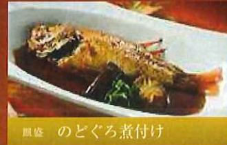
皿盛 のどぐろ煮付け