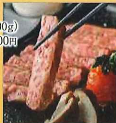
若狭牛ステーキ(約100g) 4,500円