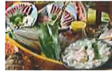
福井ならではの新鮮魚介