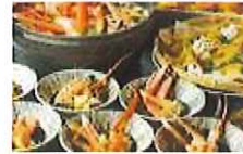
甘みのあるベニズワイガニ