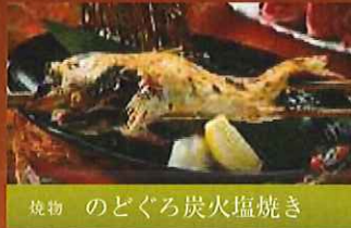
焼物 のどぐろ炭火塩焼き