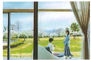
3月下旬~4月中旬は、咲く時期が少しずつ異なる桜が順々に花開き、長い期間桜を楽しめます。