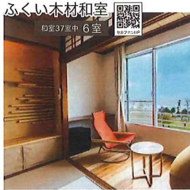
和室37室中 6室 セルフネン