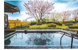
桜シーズンには花見露天風呂となり、大変人気があります。

泉質 ナトリウム・カルシウム塩化硫酸 効能 疲労回復、関節痛、筋肉痛、五十肩、痔、神経痛、打ち身、美肌効果、慢性消化器病、冷え性