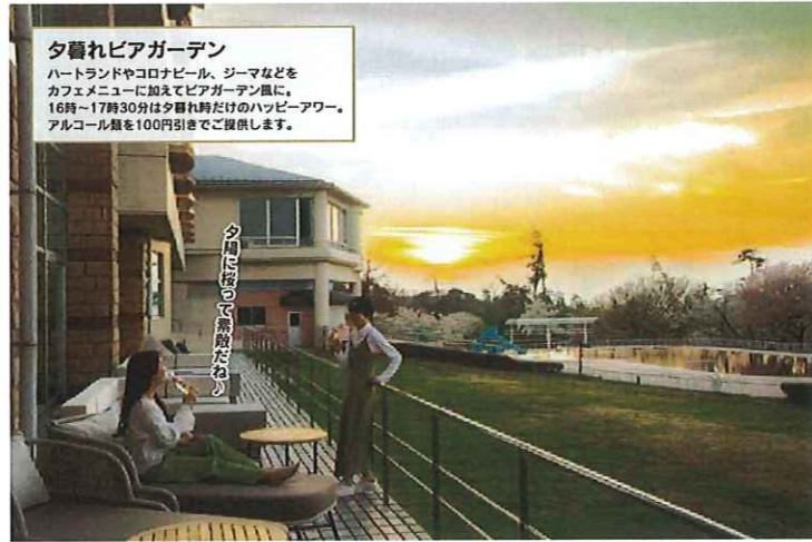
夕暮れビアガーデン ハートランドやコロナビール、シーマなどをカフエメニューに加えてビアガーデン風に。16時~17時30分は夕暮れ時だけのハッピーアワー。アルコール類を100円引きでご提供します。