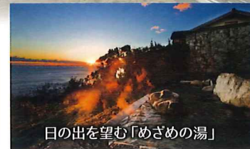
日の出を望む「めざめの湯」