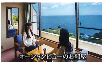
オーシャンビューのお部屋