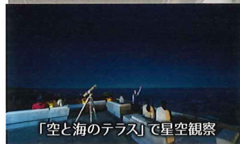
「空と海のテラス」で星空観察