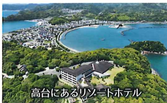
高台にあるリゾートホテル