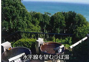
水平線を望むつぼ湯