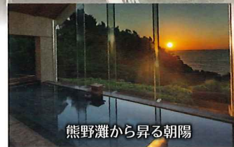
熊野灘から昇る朝陽