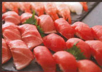
天然本マグロの握り寿司

鮮度が命の天然本マグロを、贅沢に厚切りで。しっとりとした舌触りと、口の中に広がる深いコク。素材の良さをダイレクトに味わえる、究極の一品。