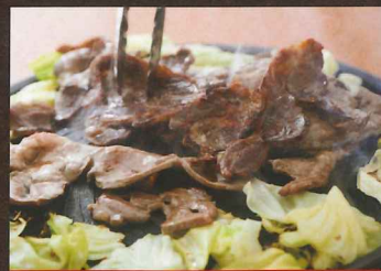
名物ジンギスカン

とろける旨さ、まさに海の宝石。厳選された天然本マグロを、職人の技で丁寧に握りました。赤身の濃厚な旨みとシャリの絶妙なバランスを、ぜひ感じてください。