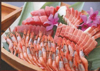
天然本マグロの刺身

鮮度が命の天然本マグロを、贅沢に厚切りで。しっとりとした舌触りと、口の中に広がる深いコク。素材の良さをダイレクトに味わえる、究極の一品。